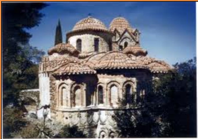
Část klášterního komplexu Vrontóchiónu