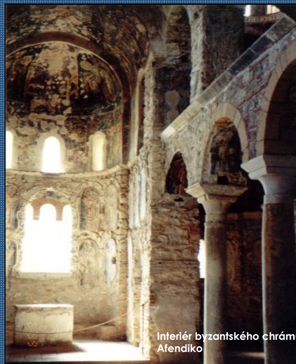
Interiér byzantského chrámu Afendiko

S sebou vezměte pohodlnou obuv a dostatek vody.