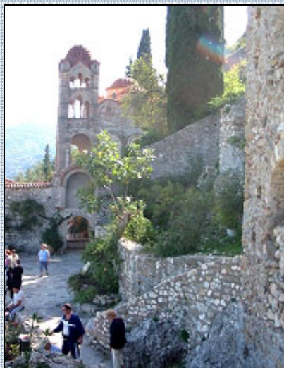
Svahy jsou zdobeny desítkami kostelů a klášterů