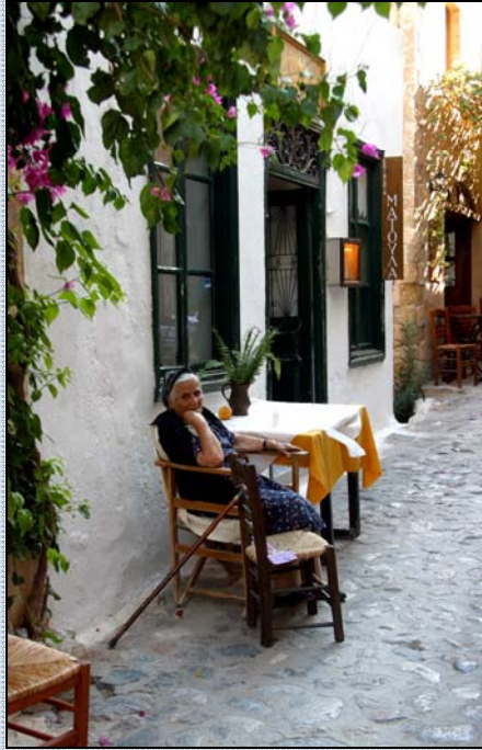
Siesta v klidných uličkách