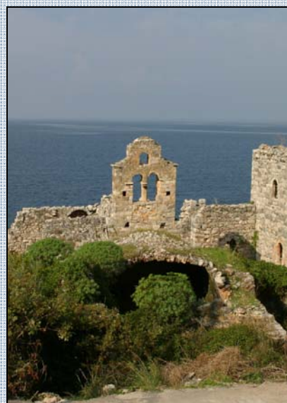
Zbytek sakrální stavby v Itylu

Za osvobozené války Turci staré město vypálili. Francouzi je ve 30. letech 19. století znovu vystavěli. 14. září 1986 postihlo Kalamatu silné zemětřesení. 10.000 osob přišlo o přístřeší.