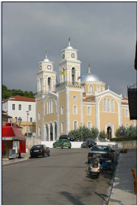
Pravoslavný kostel v Kalamatě