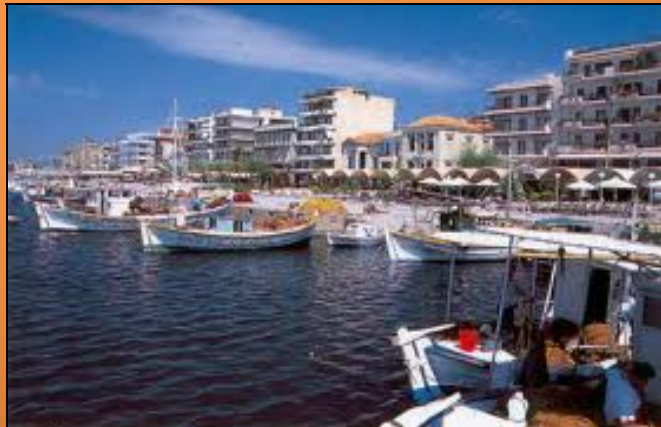
Rušné centrum mesta